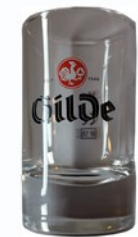
Lüttje Lage Bier